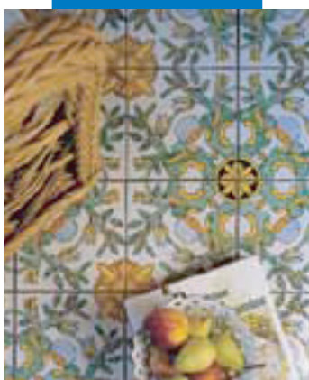
Példa fugázott kétszer-égetett padlóburkolatra