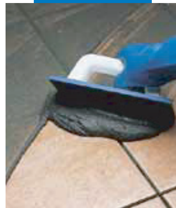
Egyszer-égetett burkolólap fugázása simítóval