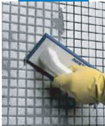
Üvegmozaik (fürdőszoba) fugázása simítóval