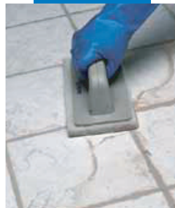
Tisztítás Scotch-Brite® súrolószivaccsal