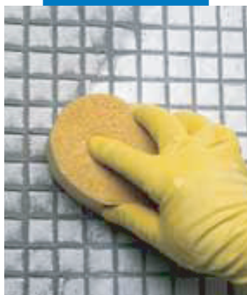
Üvegmozaik tisztítása szivaccsal